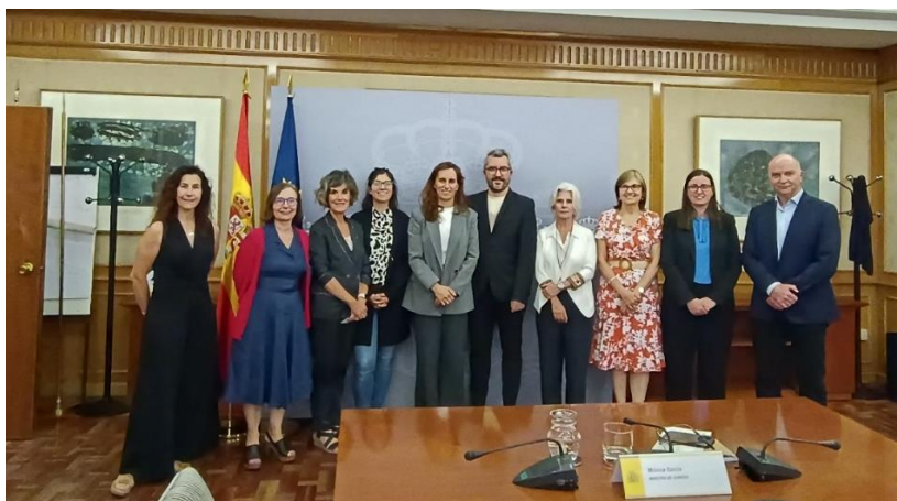
Asistentes a la reunión del 13 de junio en el Ministerio de Sanidad

El motivo de la celebración de esta reunión fue la presentación de los actuales miembros del comité al nuevo equipo de gobierno del Ministerio de Sanidad, así como dialogar y compartir ideas sobre temas de interés común.