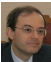
Secretario (con voz y sin voto)

Es licenciado en Filosofía por la Universidad de Alcalá de Henares, en Teología y en Biología por la de Granada, y Master en Genética por la de California (USA). Es doctor en Ciencias y profesor de Investigación ad honorem del Centro de Biología Molecular del Consejo Superior de Investigaciones Científicas en la Universidad Autónoma de Madrid. Ha participado en numerosos comités nacionales e internacionales sobre bioética.